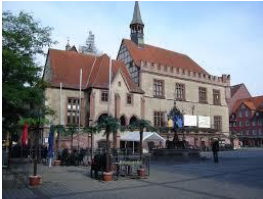
Altes Rathaus und Gänseliesel